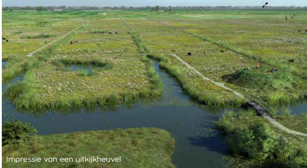
Impressie van een uitkijkheuvel

Aan twee belangrijke kwesties voor het inrichtingsplan wordt nog hard gesleuteld. Ten eerste wordt nagedacht over het watersysteem. Wat zijn de juiste peilen om te zorgen voor de gewenste natuurontwikkeling? En hoe houden de bewoners aan de zuidkant van het gebied droge voeten? Ten tweede krijgt 'recreatie' veel aandacht. Hoe kan het natuurgebied Ruygeborg straks op een aantrekkelijke manier